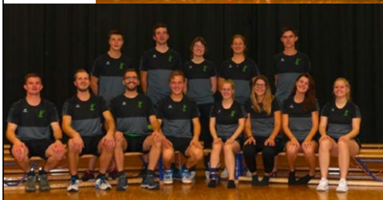
Leiterteam der Jugendriege