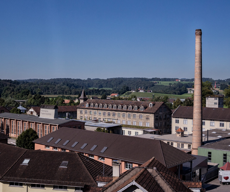
Industriegeschichte zum Anfassen in der einstigen Papierfabrik Bischofszell.